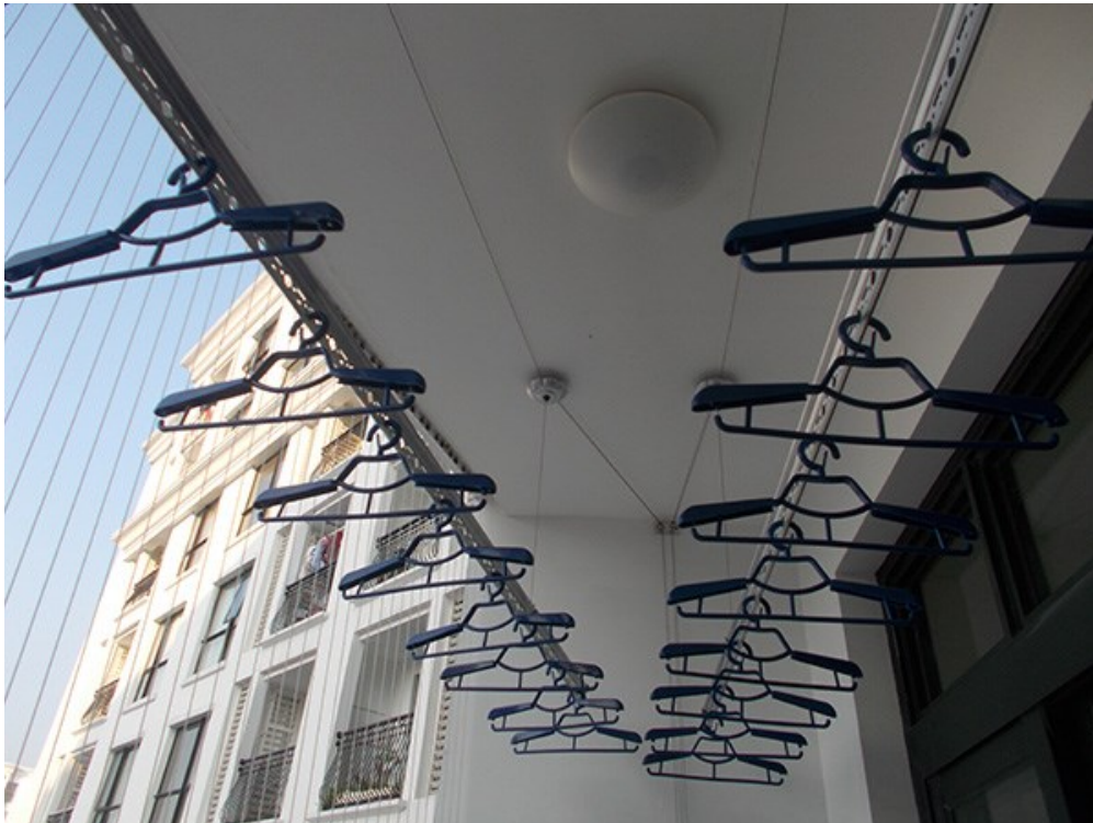
Xác định trước kiểu lắp giàn phơi thông minh

Trước hết, bạn cần căn cứ vào kiểu không gian của nhà mình để chọn cách lắp đặt song song hay là nối tiếp. Cách lắp giàn phơi thông minh song song thì sẽ để hai thanh phơi nằm song song với nhau và khoảng cách giữa chúng là 30-40cm. Còn với cách lắp giàn phơi đồ thông minh nối tiếp thì hai thanh lắp tiếp nối nhau, kiểu này thường sử dụng cho kiểu ban công dài hoặc hành lang. Nếu như bạn không chắc chắn, bạn hãy liên hệ đơn vị cung cấp lắp đặt giàn phơi thông minh Hòa Phát theo số 096 8133261 để được tư vấn cụ thể về kiểu lắp.